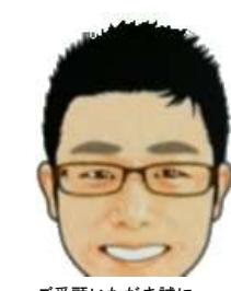
ご愛顧いただき誠にありがとうございます！