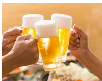
飲みすぎにご注意！

「年末年始で疲れた身体にお蕎麦を食べて健康回復」年末年始と御馳走三昧にお酒三昧(汗)気が付いたら少々体調不良。しばし体調が心配になります。そこで年越し蕎麦以外にも新年からどんどん食べたい年明け蕎麦！まずは、お酒で疲れた肝臓に負担をかけた