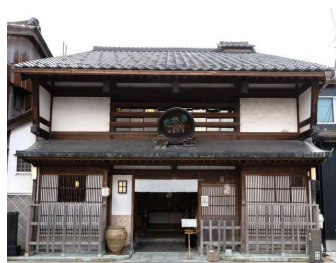
そば処「越前市」の名店！

「福井そば情報サイト」ふくいそばonlineより越前おろしそばや県産そばを食べられるお店をご紹介します。「越前そば」の名が生まれた老舗そば店。「うるしや」20年前ほど前に一度閉店するも、2019年に復活を果たした越前市の老舗「越前そば」という名前が生まれるきっかけとなった店とも言われており、これまで数々の文化人や政治家がのれんをくぐってきました。名物は「名代おろし蕎麦」や「名代蕎麦やまかけなめこ」。抹茶を混ぜ込み、美しい緑が